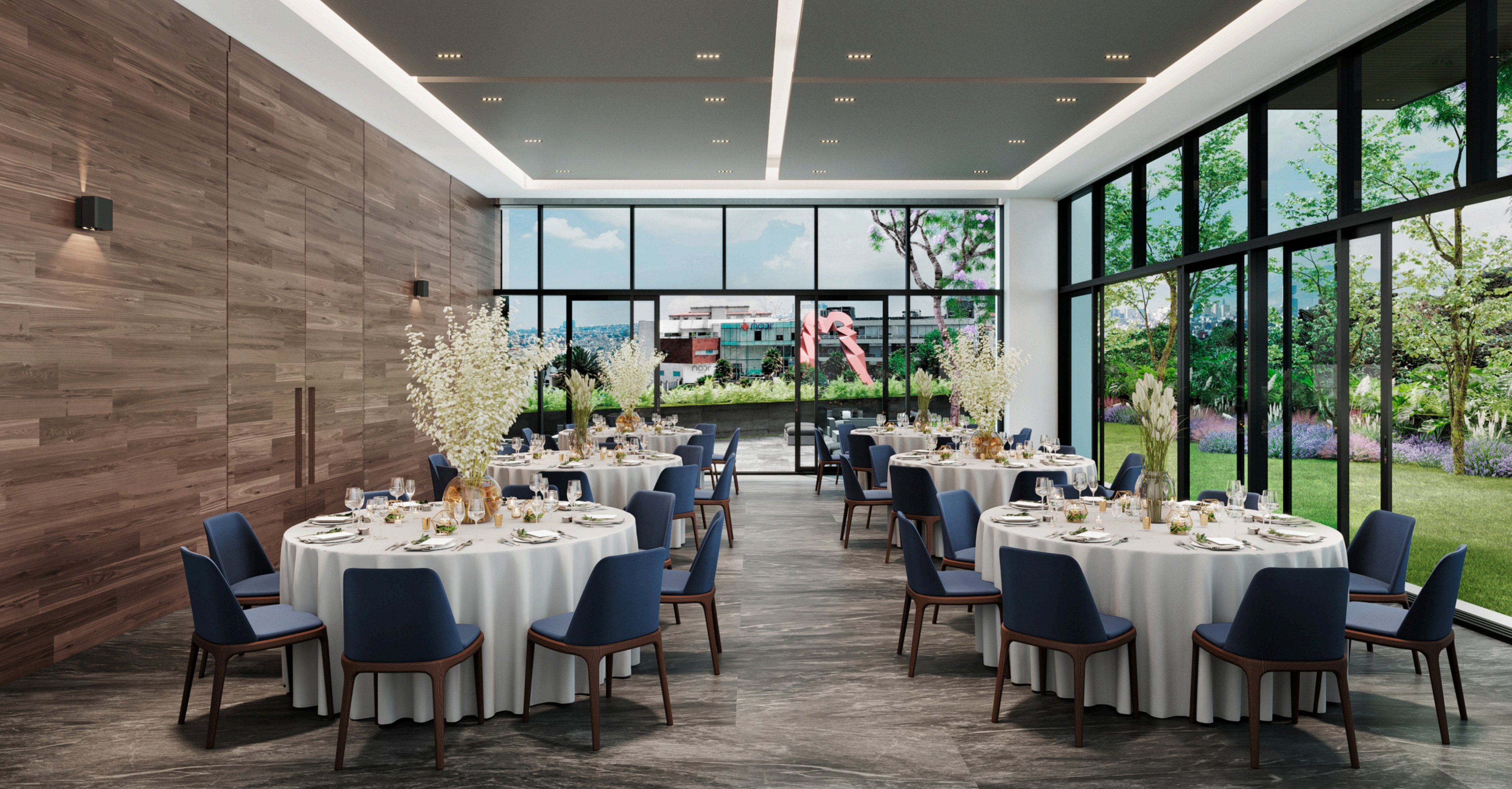
SALÓN DE EVENTOS